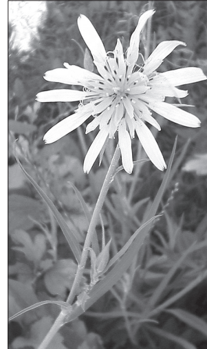
Козельці лучні рятували місцевих жителів від голоду

Жінка ввійшла в історію завдяки безпосадочним перельотам, які здійснила у 1938 році за маршрутами Севастополь—Євпаторія—Очаків—Севастополь, Севастополь—Архангельськ, Москва—Комсомольськ-