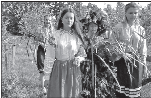
Так зазвичай водять Куста в Сварицевичах