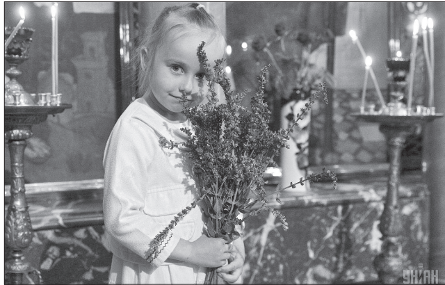
Зелені свята літо зустрічають

Троїцький тиждень поєднав народні обряди і поетичні звичаї найпрекраснішої