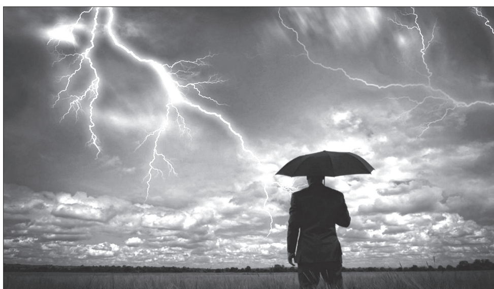
Якщо не панікувати, можна знайти вихід навіть із безнадійної ситуації