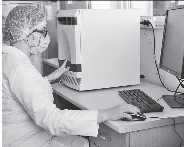
У Луганському лабораторному центрі з 3 квітня по 12 травня проведено методом ПЛР дослідження 734 особам

Саме ця обставина, на його думку, має примусити людей навіть у нинішніх умовах послаблення карантин-