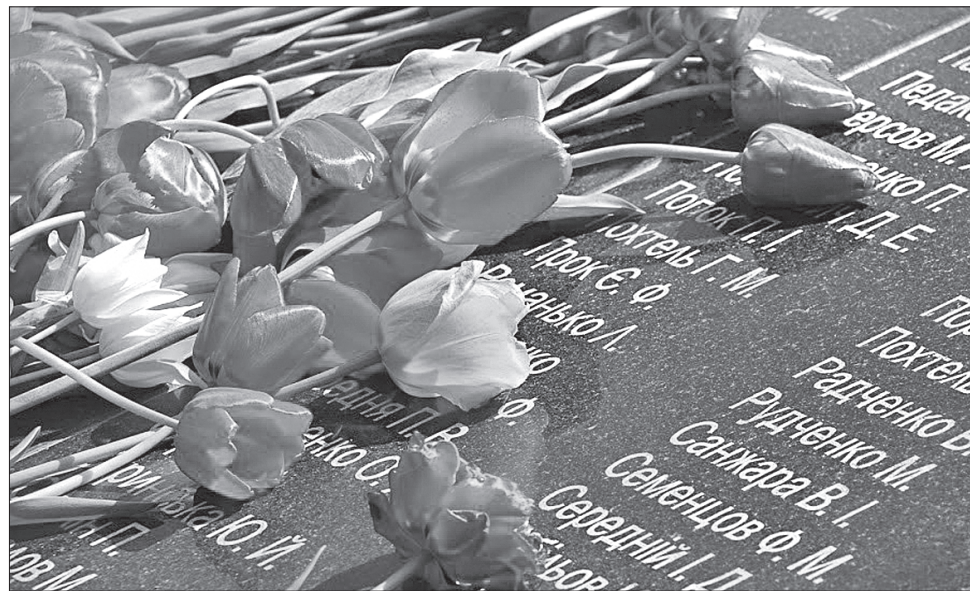
Пам'ятаємо із вдячністю...

День Перемоги? Наші батьки й діди чогось нітрохи не дивувалися, що дату ши-