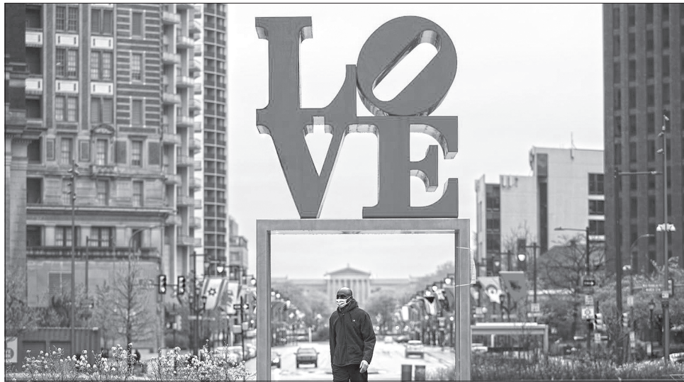
У штаті Пенсильванія карантин триває попри протести

Живу в містечку Рідінг у передмісті Бостона, штат Массачусетс. Працюю в Бостоні, який за 15 хвилин їзди на автомобілі (приблизно півтора десятка кілометрів). До початку епідемії усі трудилися в офісі, нині нас