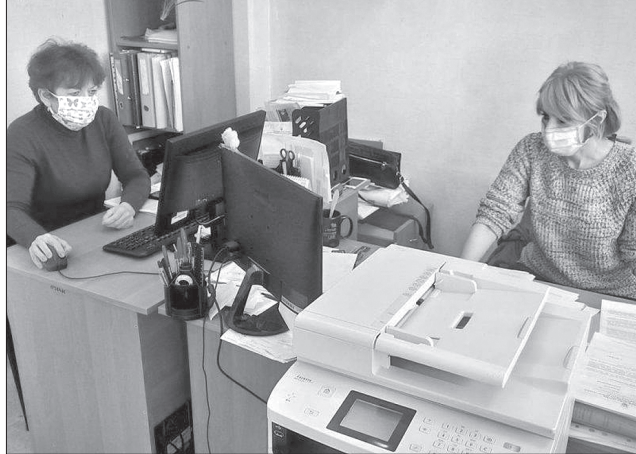
Щоб запобігти поширенню COVID-19, органи фонду в Луганській області стали працювати в режимі обмеженого доступу

«Щодня в області до нас приходять майже 200 людей з різних питань. Звертаються із приводу призначення та перерахунку пенсій. Нині багато звернень від пенсіонерів-медиків, які працюють, щодо перерахування у зв'язку зі звільненням-скороченням чисельності, що відбулося в березні, з новим етапом реформування системи