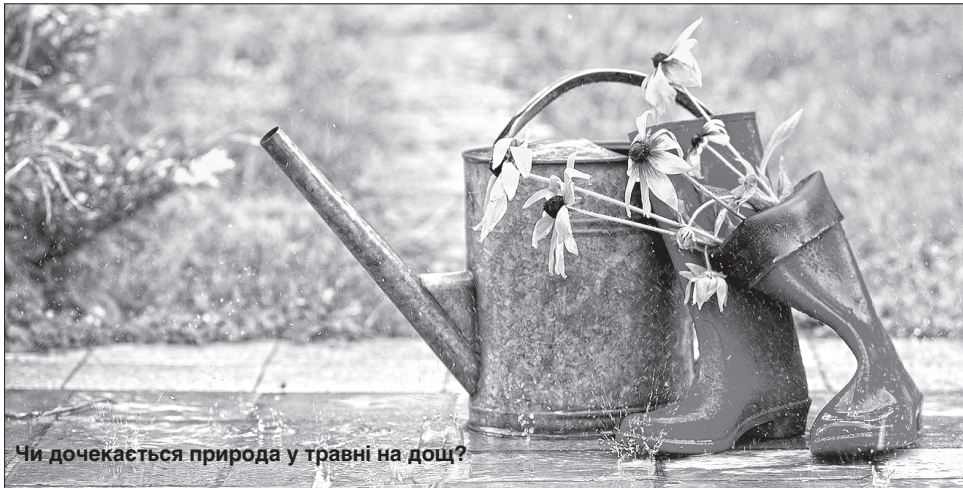
Чи дочекається природа у травні на дощ?

Були на нашій пам'яті весни з дощовими грозами, градобоями, снігопадами, морозами і суховіями. Але таке глобальне лихо о цій порі переживасмо вперше. Щодня підступна пошесть позбавляє життя тисяч людей у всьому світі. Дуже боляче, що в цей час довкола оживає природа, буяє різотрав'я, квітнуть сади. Та милуватися цією красою можна здалеку — карантин. Відвідувати моє улюблене місце прогулянок Пуца-Водичський лісопарк заборонено. Спостерігаю за природою з вікон квартири на сьомому поверсі.