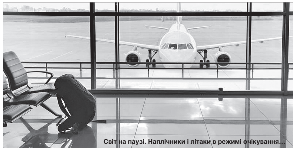
Світ на паузі. Наплічники і літаки в режимі очікування...