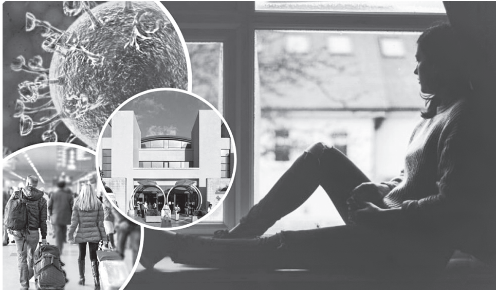
Подорож в умовах світового карантину — це ще ті випробування! Сиди вдома!

Вони повернулися до свого готелю, але їх зустріла табличка на вході: «Зачинено на карантин». Довелося швидко шукати інший. На щастя, менеджерами там працювали українці — ото вже відвели з ними дупу! Але гроші танули наче беззневий сніг, що раптом упав на зелене листя. Як кажуть, увімкнувся форс-мажор. З усіма наслідками, що на сто відсотків лягали на плечі туристів, які подо-