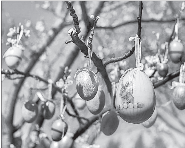
Світле свято Воскресіння Христового цього року відбудеться обов'язково, але скоріше в межах домівки

Існує народний звичай відпускати цього дня на волю птахів, що символізує звільнення людських душ від рабства гріхів.