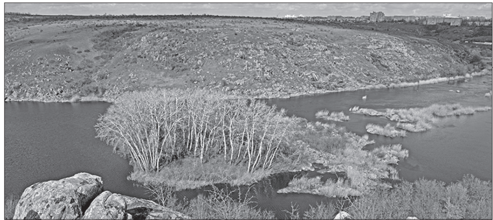
Мальовничий РЛП «Гранітно-степове Побужжя» лежить у долині Південного Бугу