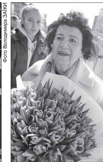
Засновниця української школи гімнастики Альбіна Дерюгіна

ЗІРКА СПОРТУ. У Києві на площі Зірок з'явилися три нові зірки. Одна запалала на честь Альбіни Дерюгіної, засновниці української школи гімнастики, друга — на честь олімпій-