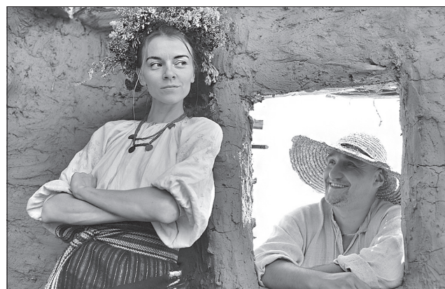
На повернення додому коханого Катерині довелося чекати аж 400 років, не старіючи і не втрачаючи надії

Після перегляду фільму розумієш, наскільки сильні і об'єднані українці. Але тут виникає запитання: чому вони дозволяють доводити ситуацію до трагедії? 400-річна історія Катерининої хати схематично зображує історію України, й складається враження, що нічого доброго в ній не було. Єдине світле — це толока. Але ж це зовсім не так!