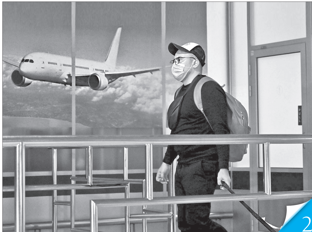
Українців закликають за змогою обмежити подорожі за кордон