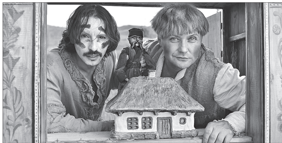
Фільм «Толока» — це історія однієї хати