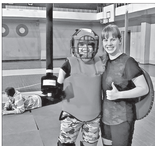
У Северодонецьку дедалі більше юних лицарів беруть участь у тренуваннях. Дівчатка також цікавляться баями

Нагороджені під час турніру були, але не програв ніхто — усіх поєднав гарний настрій та відчуття свята.