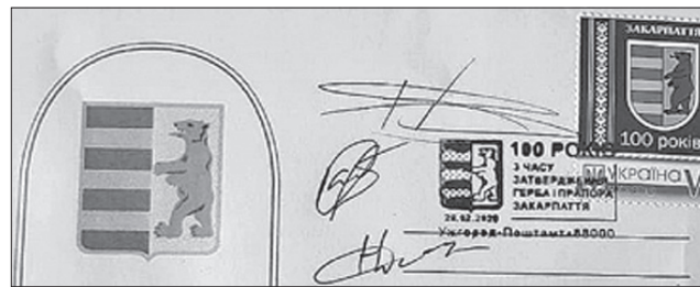
Конверт із 100-річною символікою — гербом краю за Карпатами

З нагоди 100-річчя герба у відділенні закарпатської дирекції Укрпошти відзначили цю дату. Поштовики влаштували символічне погашення спеціальним штемпелем конверта й марки, на яких зображено символіку Закарпаття.