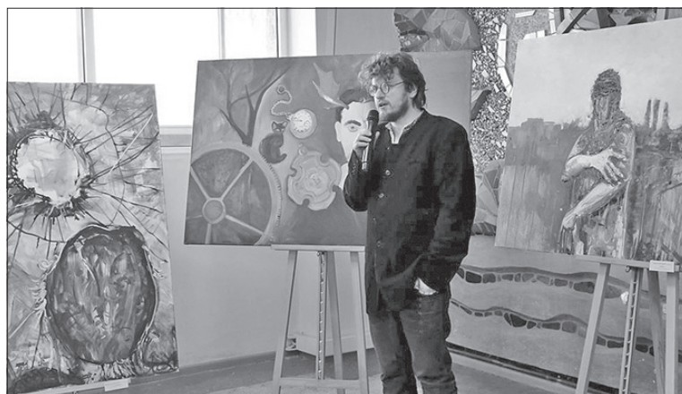
Митці кажуть: радіють, що зображений ще зруйнованим міст у Станиці Луганській відновили

За словами організаторів, ця спільна литовсько-українська акція солідарності з місцевими жителями — продовження литовської підтримки Східної України, що потерпає від бойових дій. «Особливо мене вразила картина, на якій зображено великі червоні ворота з багатьма дірками від куль, а крізь них пробивається проміння сонця, — поділився враженнями очільник області Сергій Гайдай під час презентації виставки в Северодонецьку. — Саме живопис як мистецтво не потребує слів, а показує війну».