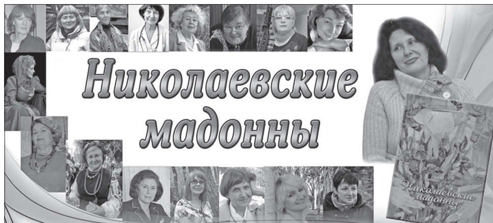
У книжці зібрано 28 журналістських нарисів

Є у книжці історії кохання, розповіді про творчі родини й тих жінок, які стали подругами, муза-