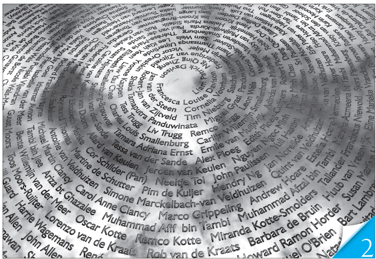
Імена всіх загиблих на борту літака рейсу MH17 зображено в імпровізованому небі національного монумента жертвам російського злочину в нідерландському Війфхузізені

ВЕРХОВЕНСТВО ПРАВА. На шостий рік після катастрофи в небі над Донецькою областю літака рейсу MH17 суд почав розгляд справи проти винуватців цього злочину