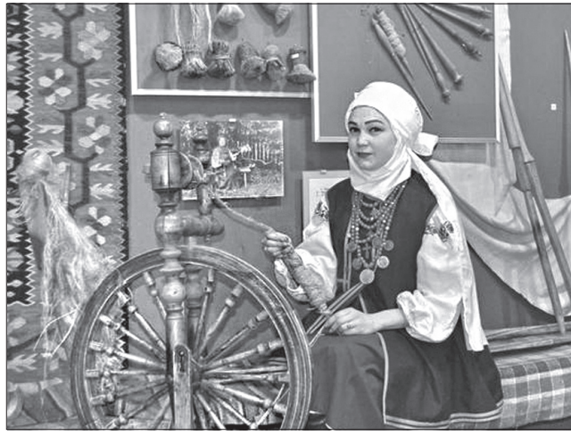
Українські жінки завжди вирізнялися смаком у доборі одягу, а тому не приховують інтересу до намітки