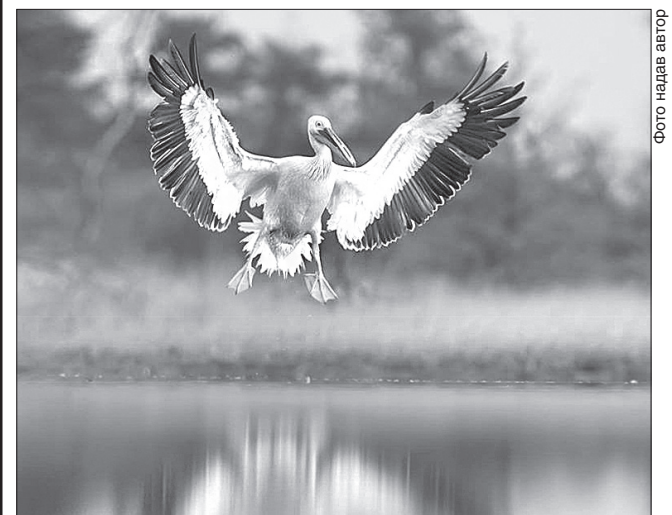
Пелікани давно обрали Кінбурнську косу

Науковці називають Кінбурнську косу «пташиним царством», адже через півострів пролітають у сезон кілька мільйонів птахів. Близько пів мільйона їх залишаються зимувати на Кінбурнській косі. Понад 300 видів пернатих оселяються тут улітку, серед них дрізд, лебідь, орлан-білохвіст, фазан, чаплі різних видів, сірий журавель та інші.