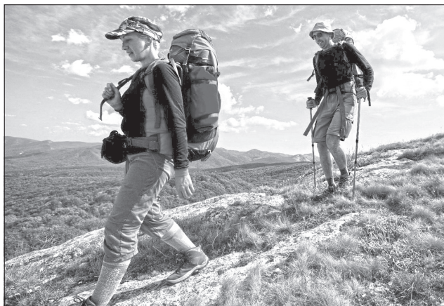
Це дуже просто — зареєструватися онлайн

Резеєструватися можна на сайті управління ДСНС України у Закарпатській області.