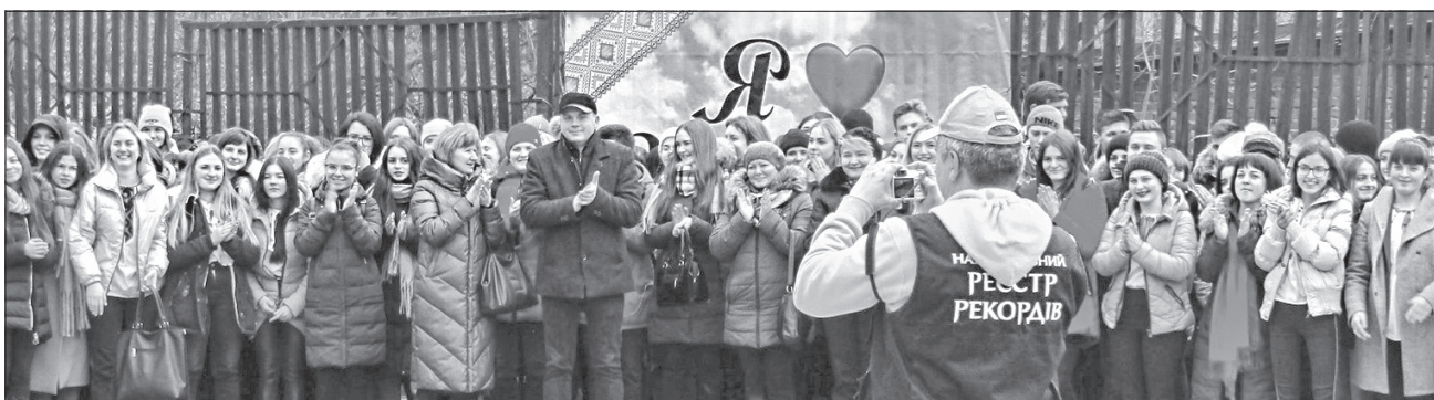
Ювілей «Червоної рuti» в місті Чортків на Тернопільщині відзначили її наймасовішим виконанням

У районному комунальному будинку культури відбувся великий концерт відкритого фестивалю-конкурсу української естрадної пісні імені Назарія Яремчука.