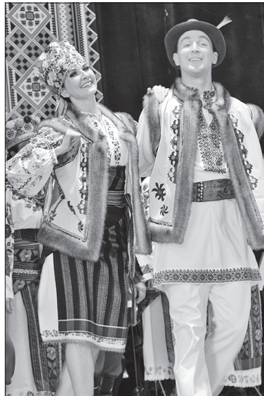
Маєм файну вроду, файні ми й у танці