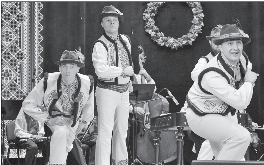
Гляньте, де ж там наші буковинки?