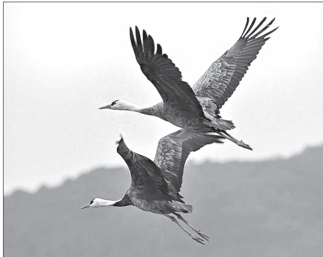
Цієї весни зустрічасмо птахів раніше, бо деякі з них далеко не відлітали, залишившись на зимівлю на півдні країни

У давні часи українці зустрічали новий рік на Євдокії (за юліанським календарем 1 березня). Цього дня