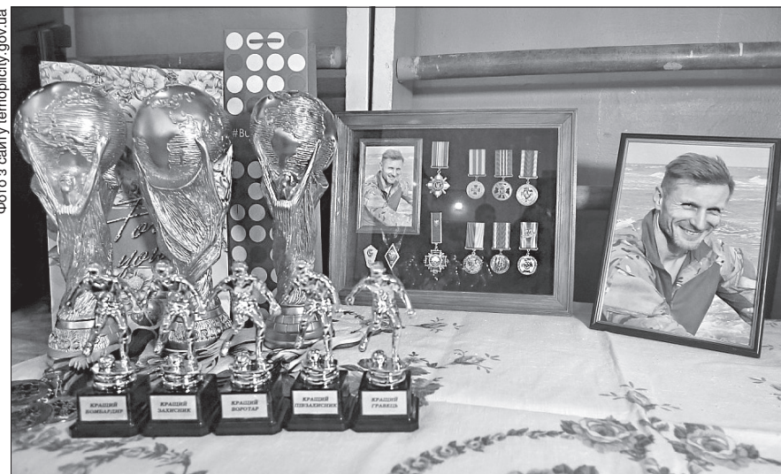
Ось такі кубки отримали переможці турніру з футзалу на вшанування пам'яті полковника СБУ Руслана Муляра, який загинув на Луганщині внаслідок ворожого обстрілу