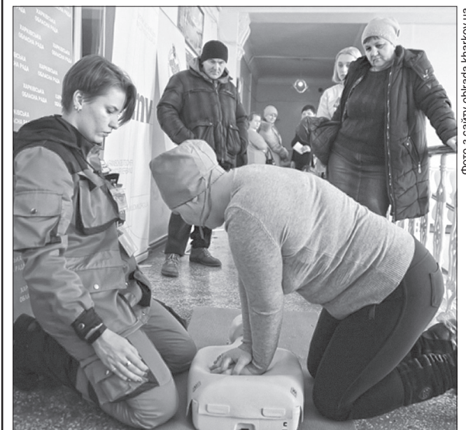
А ще на ярмарку навчали навичок невідкладної допомоги, що може знадобитися у повсякденному житті

На Харківщині це вже п'ятий ярмарок здоров'я, який проводять у межах проекту «Ефективна первинна медицина громаді», під час якого стан здоров'я перевірили більш як 2500 осіб.