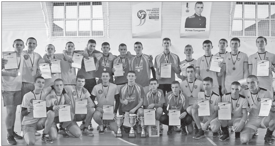
У спорті завжди перемагає дружба, хоч нагороди мають різний колір

Команда Луганського обласного лицейу з посиленою військово-фізичною підготовкою «Кадетський корпус імені геро-