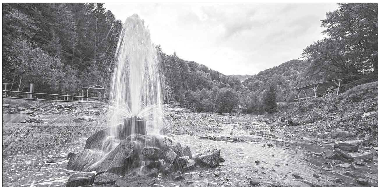
Гейзер в урочищі Петровець — свідок вулканічного періоду історії планети

Новий ЦНАП доступний для людей з інвалідністю та обладнаний дитячим куточком. Приміщення для центру капітально відремонтовано за рахунок місцевого бюджету. В межах міжнародної технічної допомоги громада одержала обладнання та програмне забезпечення.