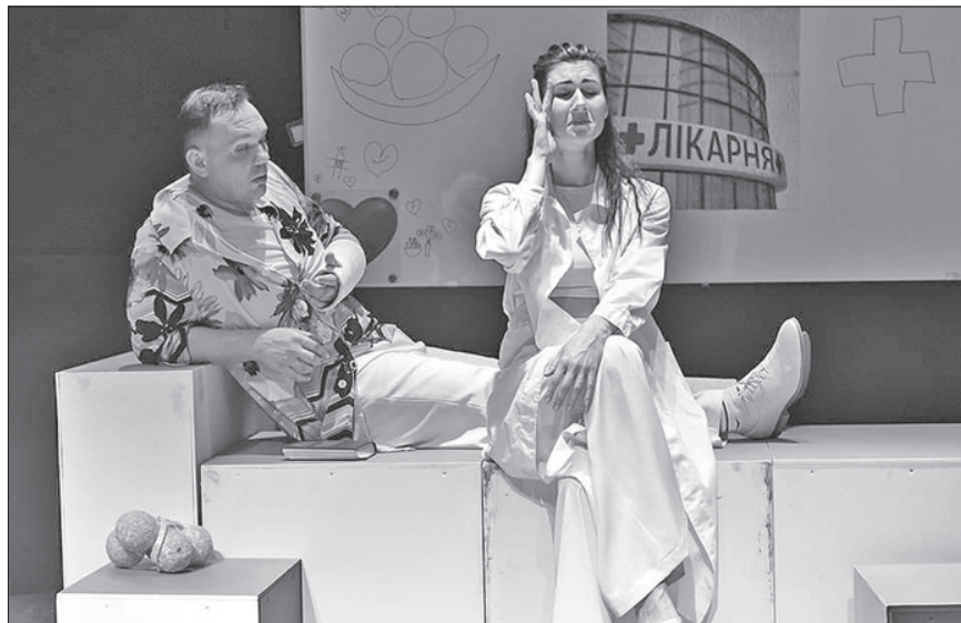
Навіть людину з найбагатшою фантазією здатен здивувати сюжет «Любові до сну»

А те, що й після прем'єри в касі розкуплено квитки на виставу, доводить шанувальники театрального мистецтва згодні з високою оцінкою нової роботи акторів.