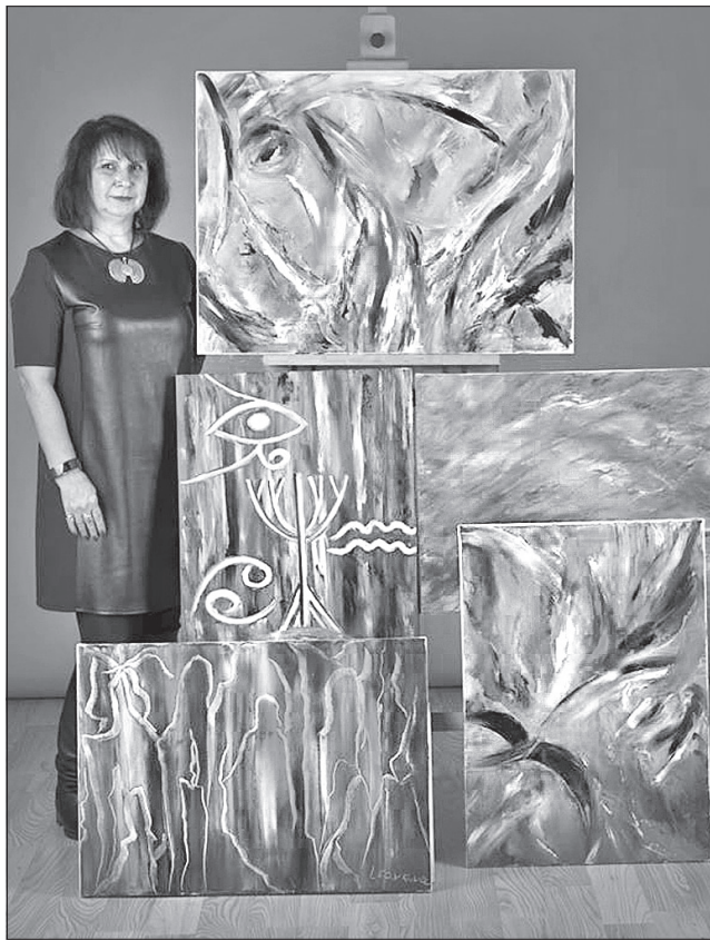
Художниця вперше представила широкому загалу свої твори