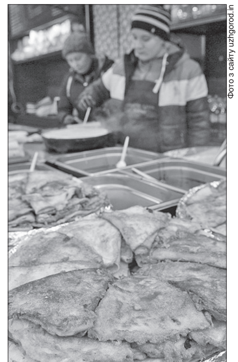
Відвідувачів дивували різноманітними начинками, формами й розмірами млинців

Великою популярністю на «Ужгородській палачинті» користувався... аероліфт. Розмістившись у корзині повітряної кулі, охочі могли оглянути і місто, і його околиці з висоти пташиного польоту.