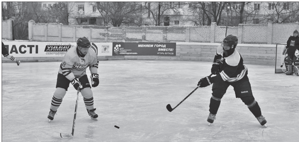
Одразу після відкриття на ковзанці відбувся хокейний матч

«Ідея виникла давно. Звернувся по допомогу, задум був з ентузіазмом прийнятий, для реаліза-