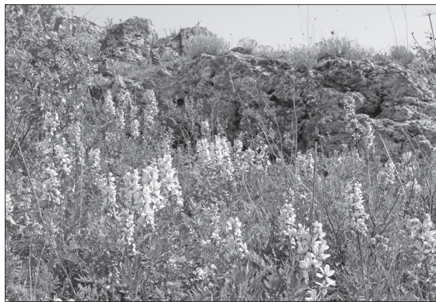
Цвіте на горі Гостра неопалима купина