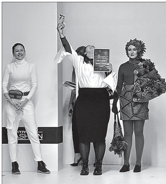
Переможці у всіх номінаціях продемонстрували неабиякі майстерність, креатив і зрілість

Думка членів журі була одностайною: молодь продемонструвала на подіумі зрілість.