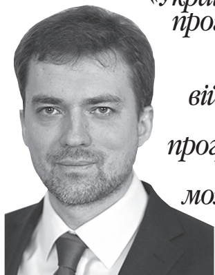
Міністр оборони про готовність України приєднатися до програми партнерства НАТО

«Україна зробила значний прогрес у впровадженні стандартів НАТО і вже відповідає військовим критеріям для приєднання до програми партнерства розширених можливостей Альянсу. Це абсолютний пріоритет для країни.»