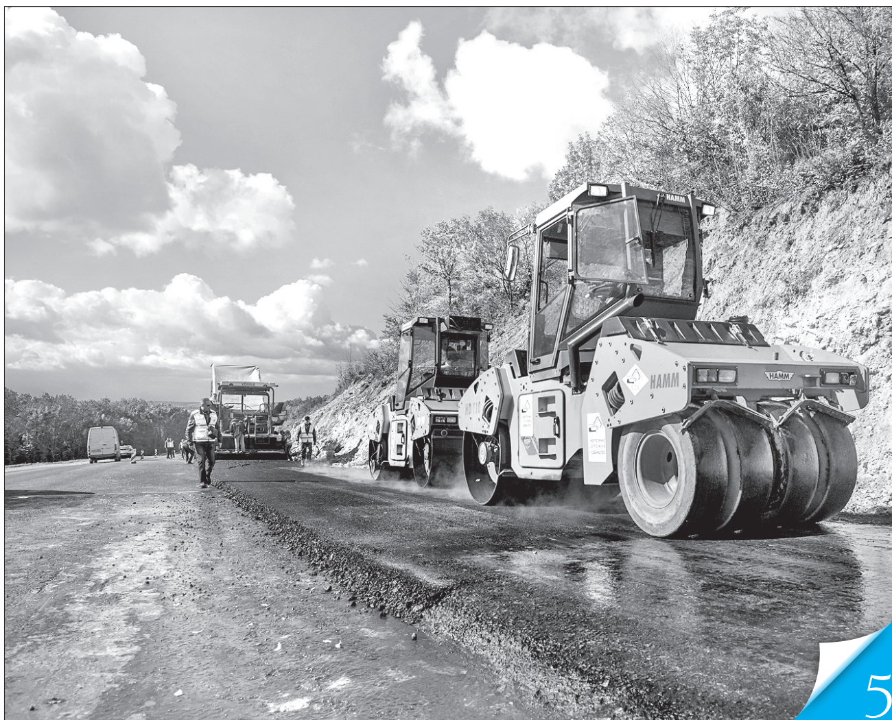
Автошлях Н-03 Житомир — Чернівці — серед державних пріоритетів цьогорічного будівництва

ДОРОГИ-2020. «Урядовий кур'єр» з'ясував, як збираються освоювати бюджетні кошти на місцях