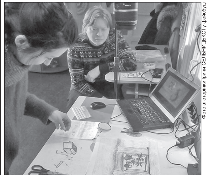
Створення мультфільму об'єднало людей різного віку

Творчий продукт, що розповідає про Колобка, який врешті-решт у пошуках роботи потрапляє за кордон до Лисички-сестрички, на думку авторів, актуальний нині в регіоні, де негативний трудовий баланс через міграцію населення.