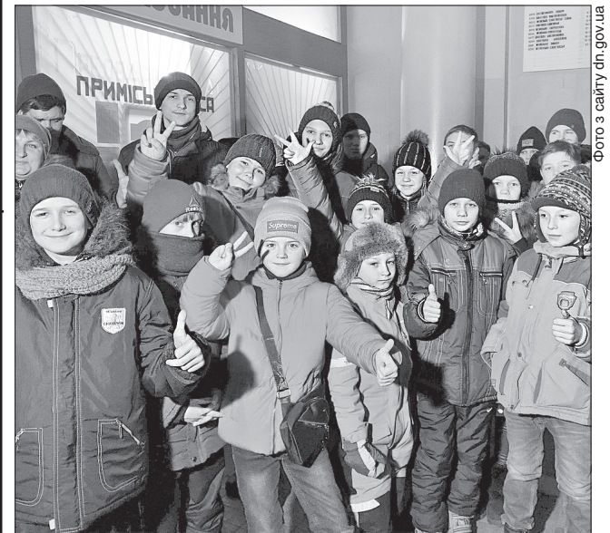
Малі гості з Донбасу задоволені своїм зимовим відпочинком

ЦІКАВЕ ДОЗВІЛЛЯ. Ще 70 дітей — малих жителів прифронтової зони Донеччини поїхали на відпочинок та оздоровлення в Івано-Франківську область. Чергова зміна вже обживається у відповідному закладі «Карпатські мрії». Під час перебування на Прикарпатті протягом трьох тижнів юні донеччани зможуть узяти участь у цікавих мандрівках мальовничими гірськими маршрутами та різноманітних зимових веселих розвагах. Безплатні оздоровлення та відпочинок для дітей стали можливими завдяки керівникам Донецької, Луганської, Львівської та Івано-Франківської обласних державних адміністрацій, які наприкінці минулого року підписали відповідний меморандум про співпрацю у цій царині. Відповідно до домовленостей, можливістю відпочити у Карпатах вже скористалися дві зміни малих гостей з Донбасу. А літньої пори вже юні жителі Прикарпаття приїдуть знайомитися із краєвидами Донеччини.