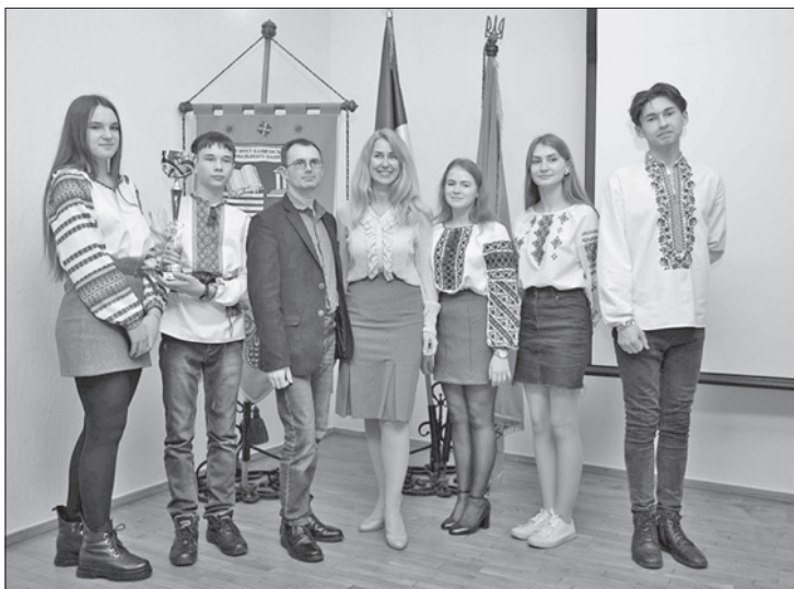
Дружна команда переможців «Черлені пацьорки»

Друге місце з харків'янами розділила команда «Vista» комунального закладу «Луцька гімназія №21 імені Михайла Кравчука», а третю сходинку п'єдесталу переможців посіли «Конотопські відьми» Конотопської спеціалізованої школи І—III ступенів №3 Сумської області, «Фінансист» комунального закладу «Фізико-математична гімназія №17» Вінницької області та «Бізнес-ангели» Чернівецького міського ліцею №1.