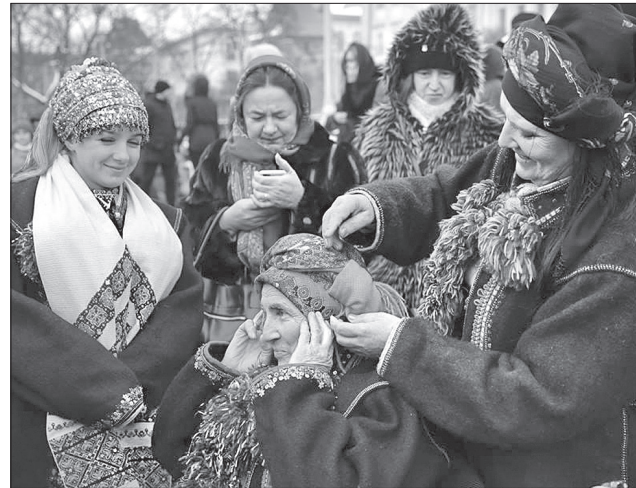
Ну і як же передати колорит життя гірського краю без акценту на автентичному вбранні горян!

Давнину й сучасність поєднали естрадні виконавці. Безперечно, не обійшлося без містечка ремесел і виставок, де кожен охочий зміг не лише оглянути, а й придбати гарні розмаїті вироби гуцульських майстрів, поласувати бринзою, іншими наїдками. Пропонували жителям і гостям Львова тури вихідного дня, запрошували здійснити туристські подорожі у Карпати, музеї Верховинського району.