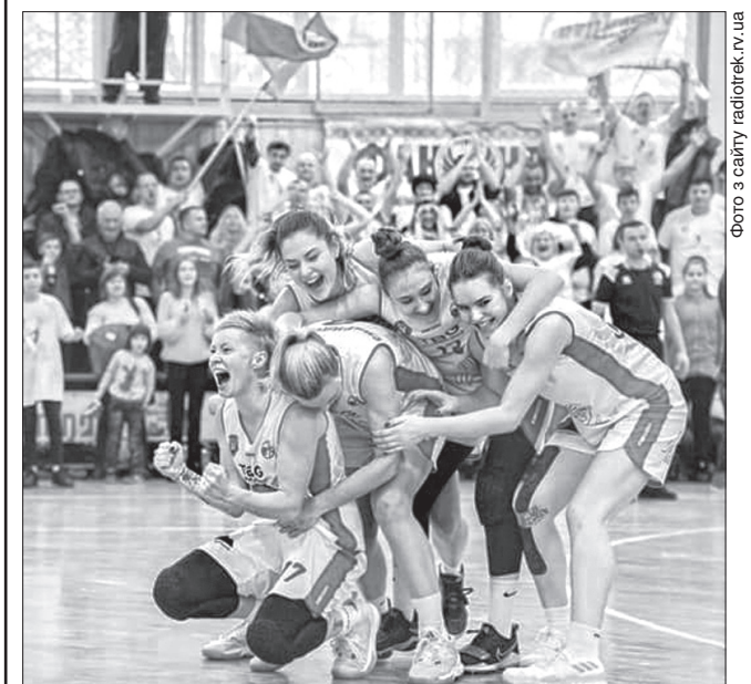
Ось вона, довгоочікувана мить перемоги!

У Миколаївському зоопарку утримують зебр Чампана, це підвид зебри бурчеллової, інша назва — саванна зебра. Це найпоширеніший вид смугастих тварин. Усього відомо чотири підвиди, які добре розрізняють за кількістю смуг на шії, за забарвленням кінцівок — для кожного підвиду характерний свій малюнок. У Миколаївському зоопарку мешкають чотири смугастики: Б'янка, Аладдін, Басар (дитинча Б'янки та Аладдіна, що народилося торік) та молода самка Панда.