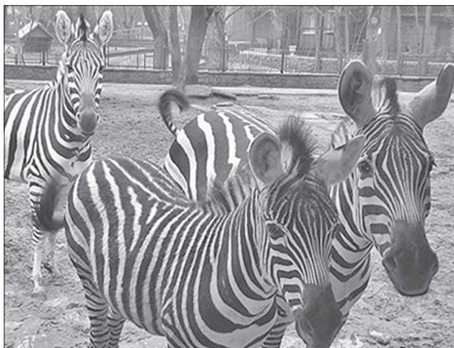
Зебри добре почувуються в Миколаївському зоопарку