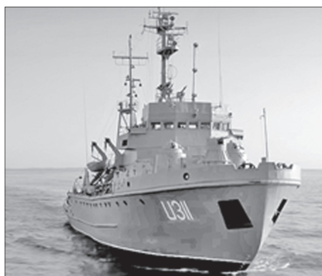
Тральщик прямує водами Чорного моря

Як розповіла продюсерка Марта Лотиш, ця картина про звичайних хлопців, які у складний період життя зробили непростий вибір. Про дружбу, зраду, честь і гідність. Фільм виробництва МКК Film service (Україна) та Inter Media (Польща) створено за підтримки Державного агентства України з питань кіно, ВМС Збройних сил України. Серед тих, хто підтримав роботу над фільмом, була й Черкаська обласна державна адміністрація.