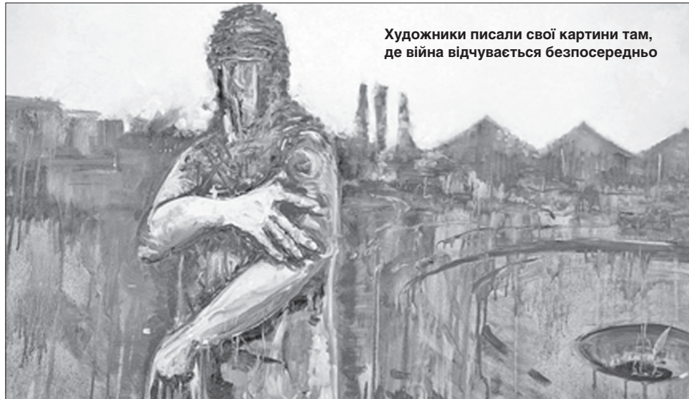
Художники писали свої картини там, де війна відчується безпосередньо

Троє митців з України і троє з Литви писали там, де війна відчу-