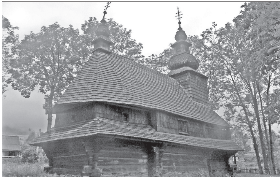
Архітектурний шедевр зберігся у вигляді, який знали ще предки

РАРИТЕТИ. Церква Святого Духа, що вже два століття простояла у селі Гукливіч Воловецького району, найдавніша серед зведених у бароковому стилі на Закарпатті. Проте вона не старіє. Її дбайливо зберігають у тому вигляді, який знали ще предки. Уже замінено дах, що протрухлявив, реставруватимуть давній іконостас. Гукливіський шедевр дерев'яної сакральної архітектури стане центральним у комплексі старовинних будівель із дерева, до яких належатиме сама церква XVIII століття, дзвіниця XIX, верховинська хата, яку сюди перенесли. У хаті влаштують музей Гукливіського літопису, де буде представлено датовану 1794 роком карту Гукливічного літопису і старовинні документи.