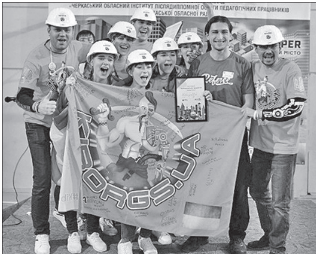
Немає меж радості чемпіонів

ІННОВАЦІЙНІ ТЕХНОЛОГІЇ. Щороку число учасників Програми FIRST LEGO League (FLL), створеної для дітей, на Черкащині відчутно збільшується. Недавно на базі 30-ї черкаської школи відбувся четвертий регіональний відбірковий фестиваль з робототехніки. У ньому взяли участь 148 команд і понад 500 учасників з усієї області. Тема творчості юних «Формуй місто» була присвячена дослідженню і розв'язанню проблем мегаполісів і розбудові зручної й доступної інфраструктури для їхніх жителів. Використовуючи набо-