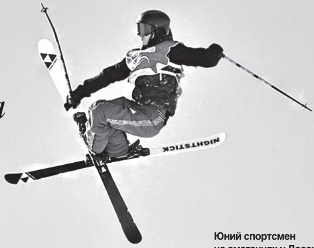
Юний спортсмен на змаганнях у Лозанні