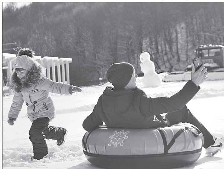
Зима хоч і не дуже щедра на сніг, але катання ніхто не скасовував

У межах соціальної програми «Активна зима» один з готельно-туристичних комплексів відкрив нову трасу для тубінгу в селі Поляна на Свалявщині. У день відкриття учасники заходу отримали сертифікати на безплатне катання. Надалі ініціатори програми планують розгорнути в області мережу тубінгових парків. До їхнього складу входитимуть альтанки, заклади громадського харчування, готельні номери, що дасть змогу відпочивальникам отримувати комплексні послуги.