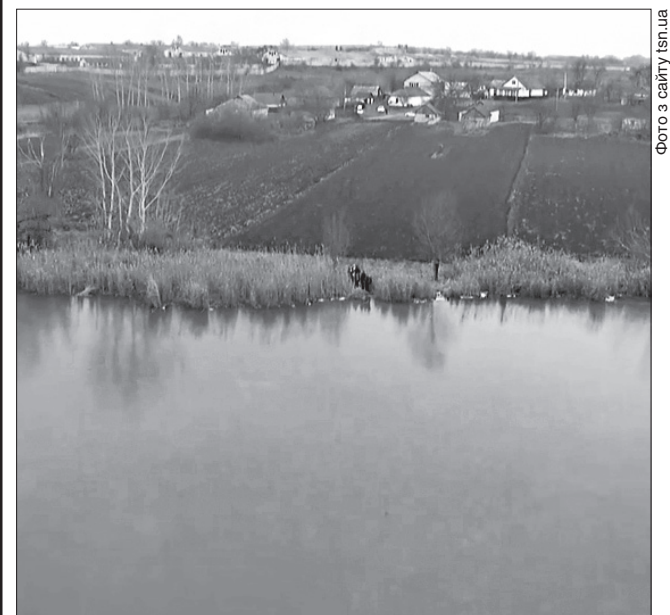
Цього року водою якщо і вкриваються льодом, то дуже ненадійним