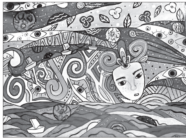
Такий вигляд мають дитячі космічні фантазії

і «декоративно-ужиткове мистецтво». Школярі продемонстрували широкі обзнаність у темі, глибокі знання з астрономії, фантазії, поєднану з науковими досягненнями. Дев'ять виробів талановитих вихованців візьмуть участь в обласному етапі Всеукраїнського гуманітарного конкурсу «Космічні фантазії», який незабаром відбудеться в обласному центрі науково-технічної творчості учнівської молоді.