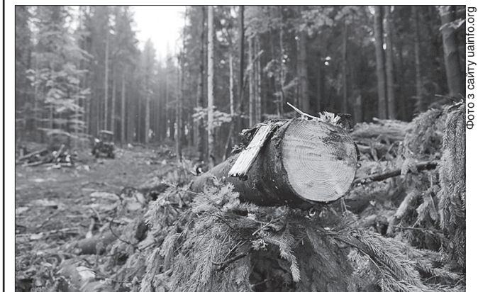
Захистити ліси від несанкціонованого вирубування дасть змогу електронний облік деревини

На нараді йшлося, що деякі рішення уряду, які передбачають обов'язковий електронний облік деревини, дадуть змогу правоохоронним органам та громадськості проводити рейди та виявляти чорних лісорубів.