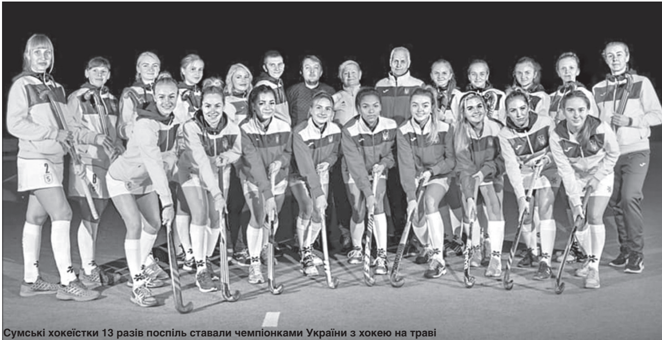
Сумські хокеїстки 13 разів поспіль ставали чемпіонками України з хокею на траві