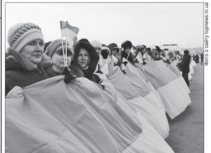
Багатолюдний ланцюг із жителів сусідніх областей

Нині Україна продовжує боротьбу за власну незалежність і соборність. А це означає повернення окупованих російським агресором територій — Криму та Донбасу.