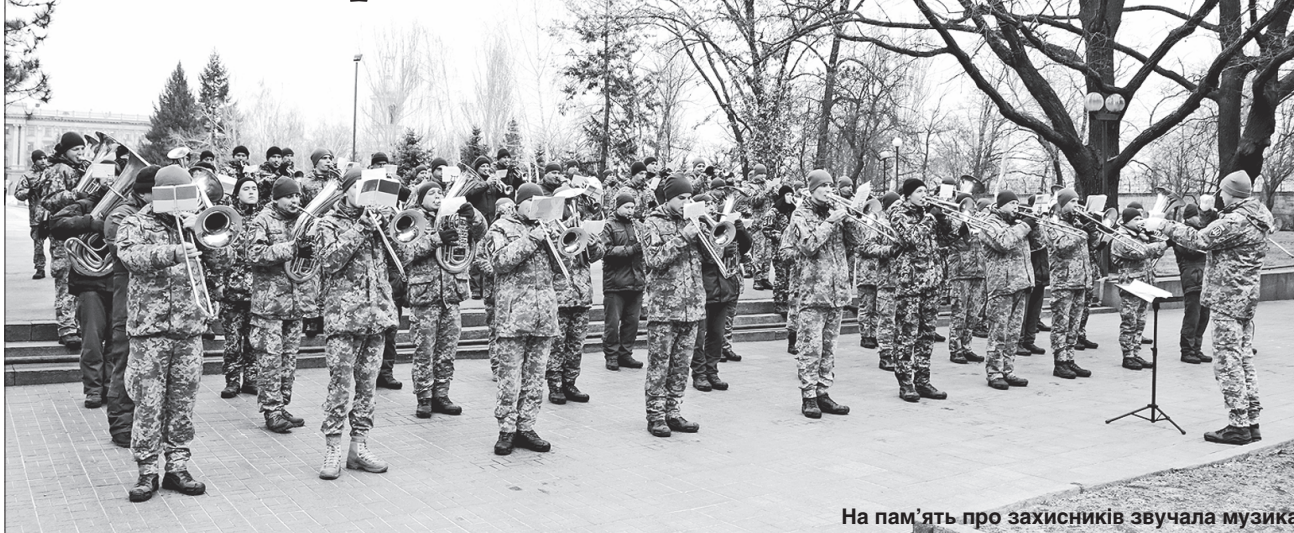
На пам'ять про захисників звучала музика