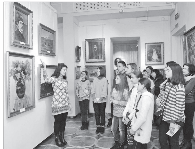
Одними з перших відвідувачів ювілейної виставки стали учні Охтирської художньої школи

митці ознайомилися із життєвим і творчим шляхом земляка. Обидві виставки працюватимуть до середини лютого.