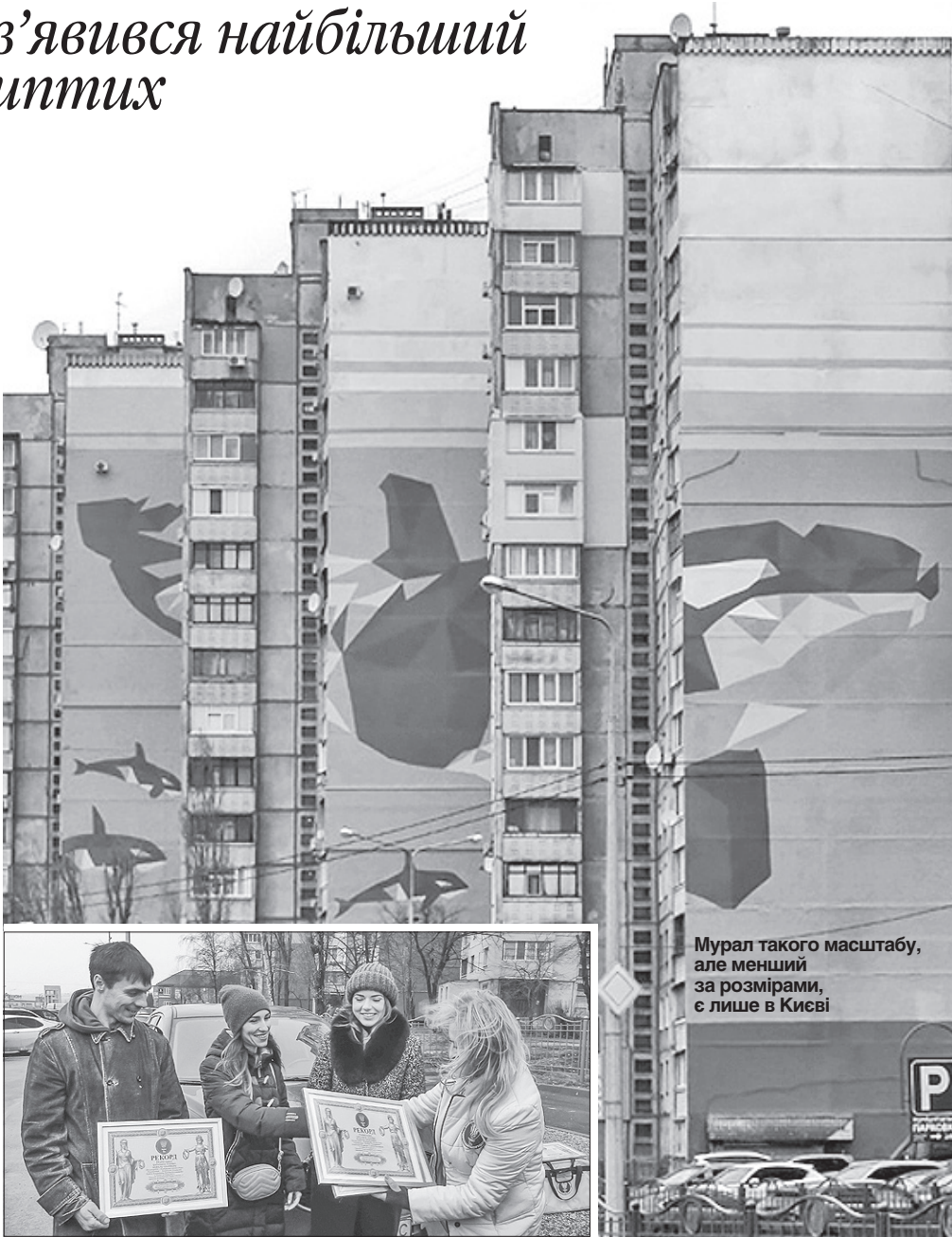
Мурал такого масштабу, але менший за розмірами, є лише в Києві

Команді авторів є чим хвалитися та гордитися