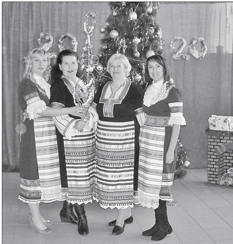
Болгарські господині на свято вбираються у національний одяг