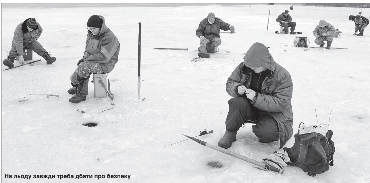
На льоду завжди треба дбати про безпеку

який попростував через нібито замерзлий ставок, вирішивши скоротити шлях, а натомість скоротив власне життя. Отож доводиться вкотре закликати не тільки дітей, а й нібито вже навчених життям дорослих не легковажити небезпекою і пам'ятати, що зимова вода не прощає найменшої необережності.