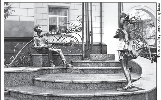
Тернополяни підтримали цей проєкт пам'ятника