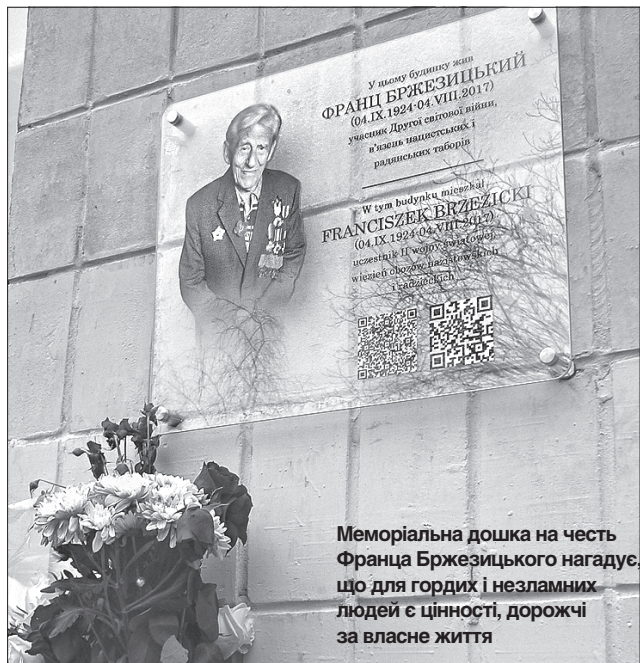
Меморіальна дошка на честь Франца Бржезицького нагадує, що для гордих і незламних людей є цінності, дорожчі за власне життя

Франц Бржезицький народився 4 вересня 1924 року в сім'ї житомирців-поляків, яка зазнала переслідувань у 1937 році. Батька розстріляли, матір заслани в Сибір, а на 13-річного підлітка очікувала хресна дорога вихованця спеціалізованого дитбудинку. Юний Франц утік від радянських катів-енкаведистів і переховувався у Житомирі, доки якимсь дивом не влаштувався на роботу в пекарню. Під час Другої світової війни хлопець разом із друзями створив молодіжну антифашистську організацію. Наприкінці 1942-го під