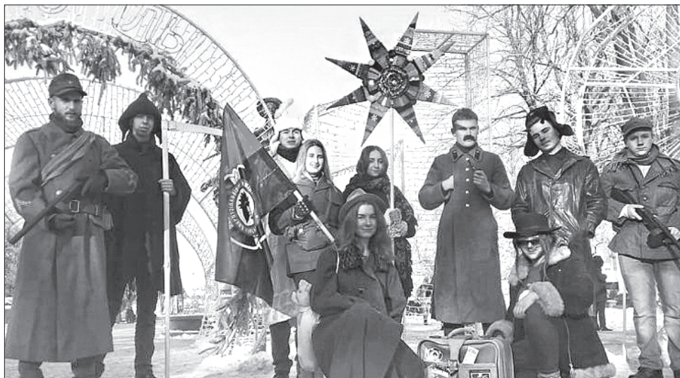
Десять хлопців і дівчат з Тернопільщини показали жителям Донецької області вертеп, який влаштовували колись воїня УПА

Молоді тернополяни — члени Молодіжного націоналістичного конгресу 2018 року організували повстанський вертеп. Його сценарій написали самі. Згідно з ним, українські повстанці разом зі зв'язковою та звідарем звіщають радісну новину про народження Ісуса Христа. Але ж є Ірод, тобто сила зла. Тож юнаки й дівчата з огляду на наше комуністичне минуле вдалися до творення образів конкретних осіб, які уособлю-