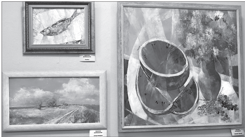
Художники відобразили настрої мальовничого куточка Миколаївщини