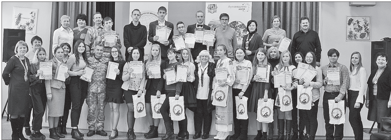
Понад сотня учнів узяла участь в обласній краєзнавчій конференції «Луганщина — мій рідний край»