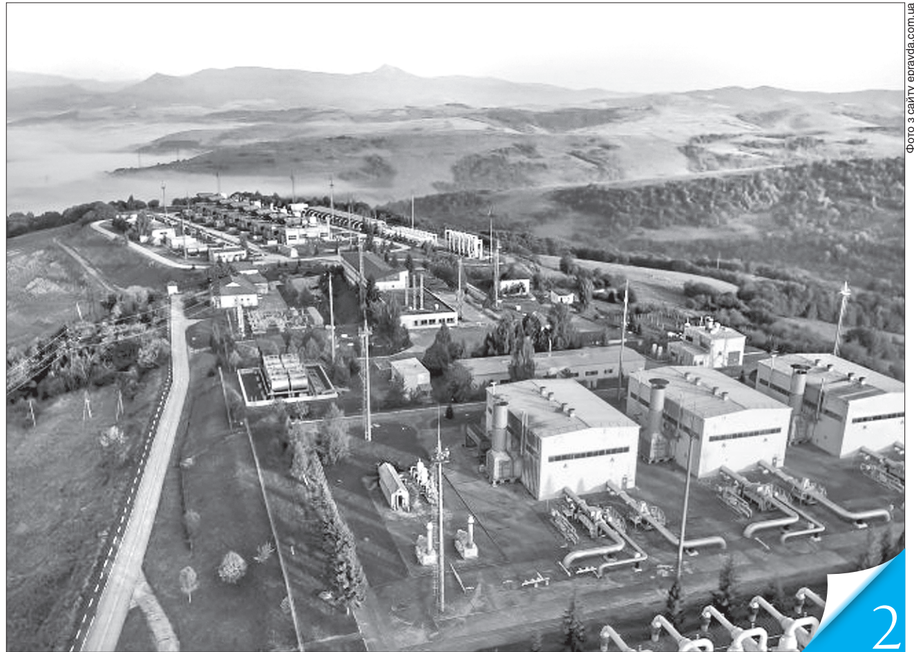
Вітчизняні підземні сховища газу відіграють ключову роль у роботі всієї ГТС

НАРЕШТІ. Наша держава повністю контролює свою газотранспортну систему та інтегрується в європейський ринок