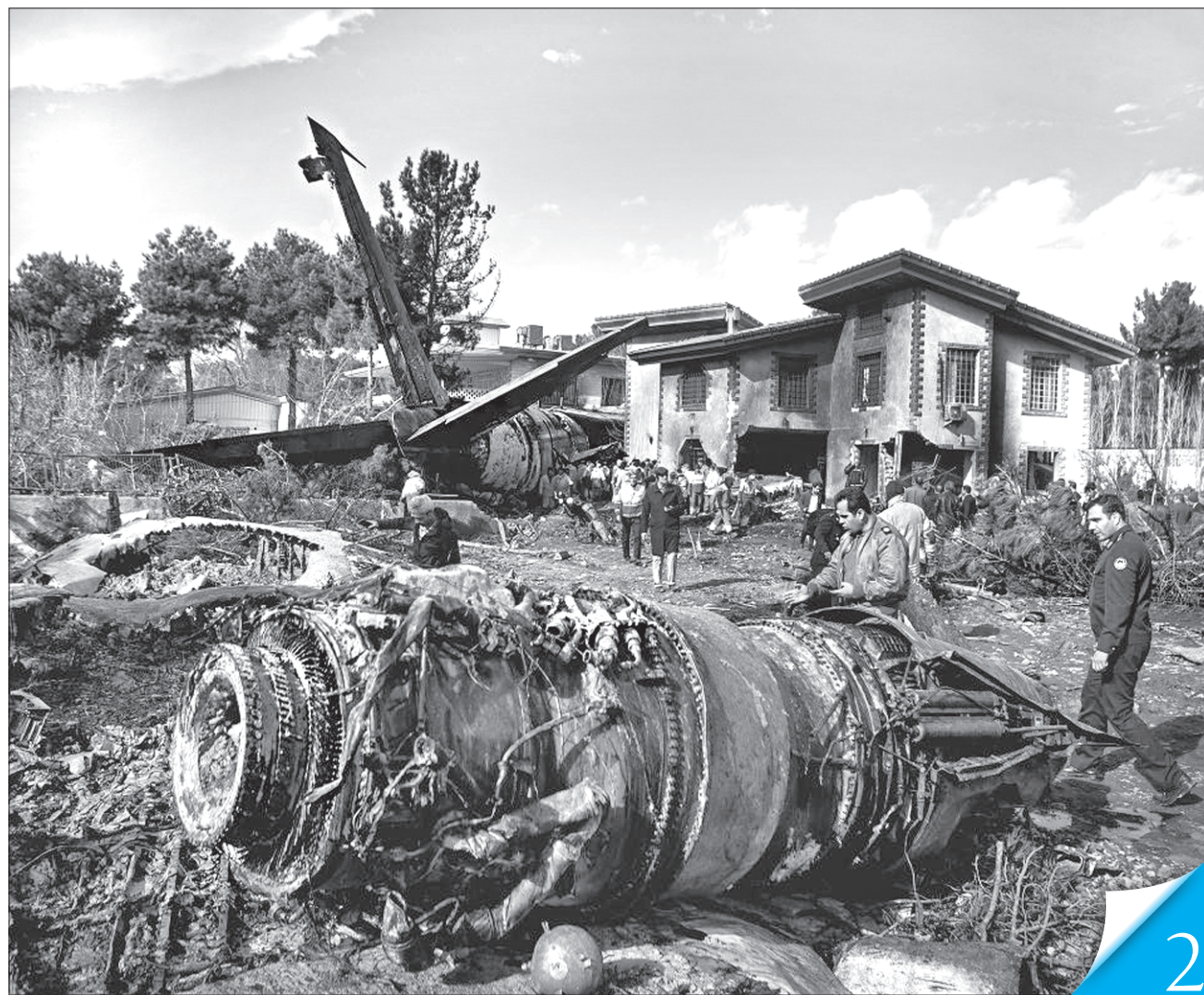
Boeing 737-800 NG авіакомпанії «МАУ» зазнав катастрофи і впав неподалік аеропорту Тегерана

АВІАКАТАСТРОФА. На борту українського літака перебували 176 людей — пасажирів та члени екіпажу. Всі вони загинули