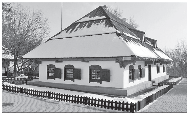
Найбільше коштів знадобиться на ремонт покрівлі садиби

ОБНОВЛЕННЯ. «Будеш, батьку, панувати, поки живуть люди; Поки сонце в небі сяє, тебе не забудуть!» — писав Кобзар у вірші «На вічну пам'ять Котляревському». І як у воду дивився. Не забувають і шанують автора «Енеїди», «Москаля-чарівника», «Наталки Полтавки». Нещодавно земляки відзначили 50-річчя його садиби в Полтаві. А під час заходу в керівників міста виникла ідея зробити