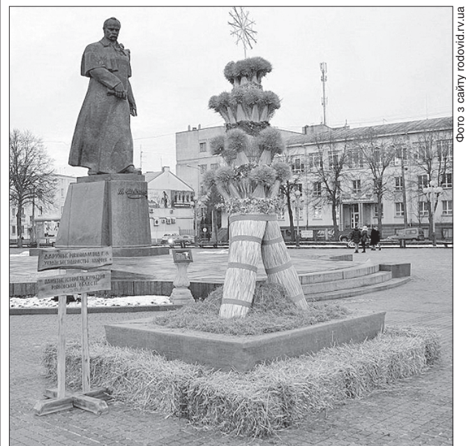
Ось такий різдвяний оберіг зустрічає рівнян та гостей міста

АТРИБУТИ СВЯТ. Величезний дідух на Різдво зустрів рівнян на центральному майдані міста. Його встановили представники обласної організації Українського товариства пам'яток історії та культури. Загальна висота дідуха від бруківки до верхівки зірки-хреста становить 4,3 метра. Він також відповідає всім сакральним вимогам: стоїть на трьох ногах, які формують конусну форму, та має чотири канонічних рівні. Вінчає дідух дванадцятикутна зірка — символ Творця. До створення величного Дідуха доклалися багато членів товариства, особливо жінки, які займаються відтворенням давніх українських ремесел: ткацтва, вишивання, виготовлення оберегів. Цей різдвяний оберіг зустрічатиме нас на майдані Незалежності до завершення циклу новорічно-різдвяних свят, тобто до 21 січня 2020 року.