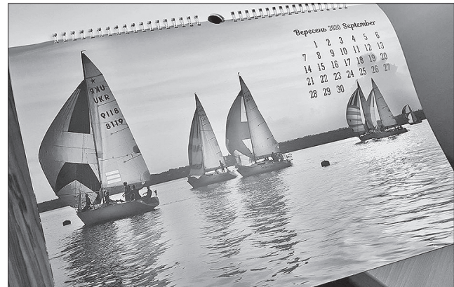
Сувенір зробили миколаївці

ІНІЦІАТИВА. Вийшов у світ сувенірний календар «Мій Миколаїв-2020», який створили самі миколаївці. У листопаді департамент міського голови оголосив конкурс, під час якого протягом тижня городяни надсилали найкращі світлинки з краєвидами міста, пейзажами в цікавих ракурсах, значними місцями. Усього надійшло 474 фотографії від 40 конкурсантів. Організатори обрали найкращих 11 фотогра-