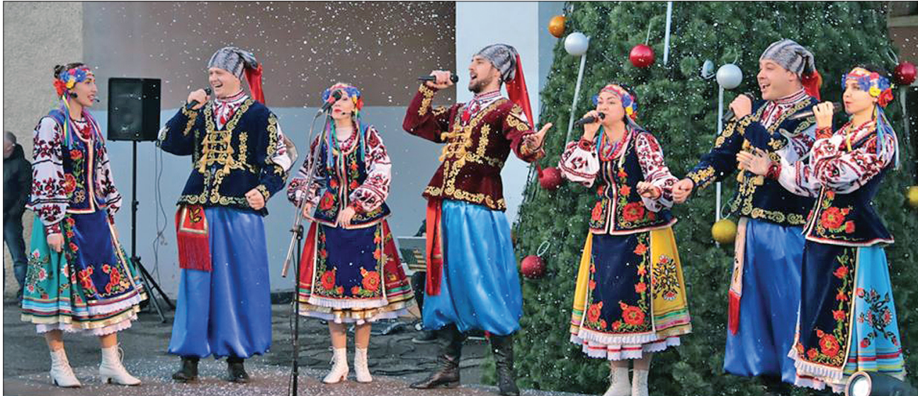
Біля новорічної ялинки у Золотому, де недавно провели розведення військ, влаштували свято

На місцевих хлопчиків і дівчаток очікувало передноворічне диво з подарунками, які приніс їм Святий Миколай. А 23 грудня вперше від початку бойових дій та облаштування лінії розмежування біля контрольно-пропускного пункту «Станиця Луганська» теж встановили новорічну ялинку і пригощали найменших хлопчиків і дівчаток солодощами.