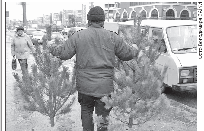
Нелегальний розпродаж ялинок на вулицях міста

Це підтверджує, що з наближенням Нового року не бракує спритних бізнесменів, які вдаються до незаконного вирубування зелених насаджень і подальшого їх нелегального продажу. А тому правоохоронці Донеччини завчасно послали перевірки на дорогах і в тих місцях, де облаштували стихійні базари для збуту сосон і ялинок. Виникають інші несправжні ситуації довкола хвойного чи штучного символу Нового року. Зокрема у Покровську на центральній площі імені Шибанкова жителі міста навіть влаштували акцію протесту проти рішення міської влади витратити на виготовлення, встановлення, прикрашання та ілюмінацію головної новорічної ялинки аж мільйон гривень. Це рішення представники влади пояснюють тим, що торік символ свята виявився нікудишнім, і тому тепер вирішили виправити ситуацію. А ось люди, які засуджують нерациональне використання бюджетних коштів, пропонують спрямувати гроші на лікування важкохворих дітей і створити благодійний фонд. Учасники мітингу навіть підписали резолюцію, яку адресують керівникам Покровська, голові Донецької ОДА та Кабінету Міністрів.