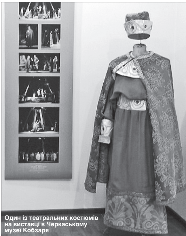
Один із театральних костюмів на виставці в Черкаському музеї Кобзаря

Автори цікаві передовсім інтелігентністю, витонченістю і душевною добротою.