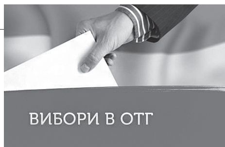
ВИБОРИ В ОТГ

5 На Закарпатті надолужують втрачений час: 22 грудня вибори відбудуться одразу в дев'яти громадах