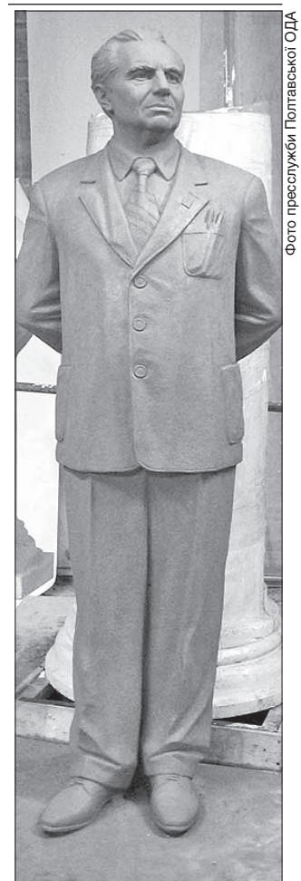
Майбутній пам'ятник повністю передає характер Лева Вайнгорта

Скульптуру відливають в одній із харківських ливарень. Майстрам залишилося тільки відшліфувати її.